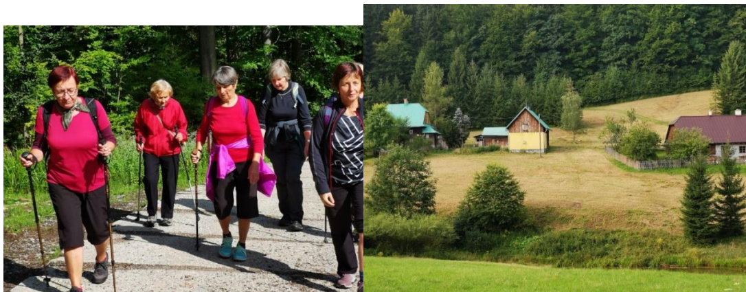
Túru jsme začali na Mezivodí a po žluté značce přes Salajku vyšli na Bumbálku