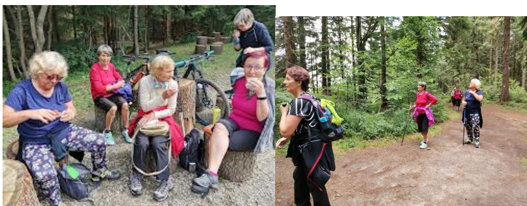
Při svačině u rozhledny Súkenické. Přes Třeštitk a Hlavatou jsme došli až na Zavadilku. Celkem 15 km